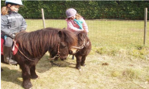
TATOUSZ et DAKOTA