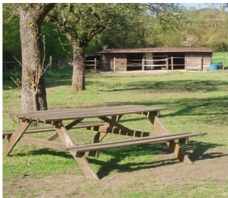
Vue sur le pré